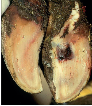
Şekil 3. Bir sığırda şiropodu sonrası Rusterholz sendromunun görünümü (10).

Şiropodu işlemi öncesinde hayvan (at ya da sığır) travaya alınarak zapturaptı gerçekleştirilir. Travayda ayak sabitlenir ve yukarı kaldırılır. Patolojinin bulunduğu bölge üzerindeki tırnak renet, tırnak kesme makası, suntraç (tırnak bıçağı) veya bistüri ile kesilerek uzaklaştırılır. Tırnağın canlı kısmına ulaşılarak hastalığın tanısı konur ve tedavisi gerçekleştirilir. Genellikle, taban ulkusu (Rusterholz sendromu) (Şekil 3), mih batması, beyaz çizgi hastalığı ve ayak apsesi gibi patolojilerde terapötik şiropodu işlemine başvurulur (2,7,9-11).