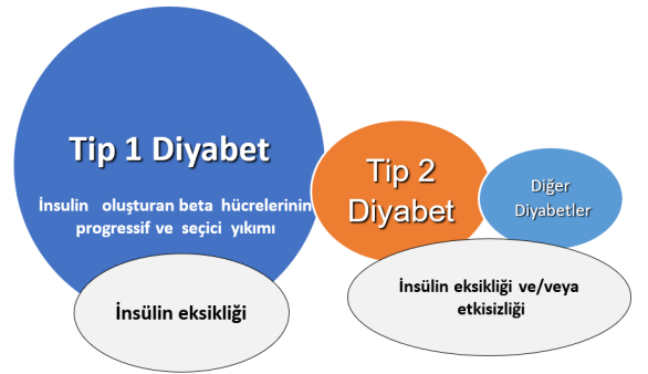
Şekil 1. Çocuk ve Adolesanlarda Görülen Diyabet Tipleri ve İnsülin Yetersizliği Durumu (Bu şekil, bölümün yazarı tarafından oluşturulmuştur).

Tip 1 diyabette pankreasta insülin salgılayan beta hücrelerinde otoimmün hasar sonucu yıkım olmakta ve mutlak insülin eksikliği gelişmektedir. Genel olarak bulgular ortaya çıktıktan kısa süre sonra tanı alırlar. Tip 2 diyabet ise temelde insülin direncinin olduğu, sıklık-