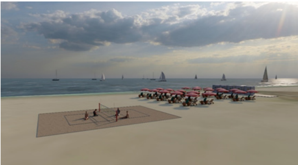
Resim 2. Engelliler Plajında Spor Aktiviteleri İçin Planlanan Voleybol Sahasının Görseli (Voleybol file ve direklerinin teknik özellikleri hazırlamakta olduğumuz projenin muhteviyatında yer alacaktır)