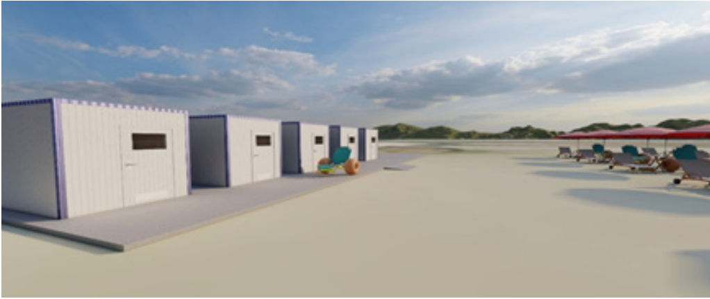
Resim 1. Engelliler Plajında Olması Gereken WC ve Duş Kabini Örneği (İfade edilen WC ve duş kabinlerinin teknik şartları hazırlamakta olduğumuz projenin muhteviyatında yer alacaktır)