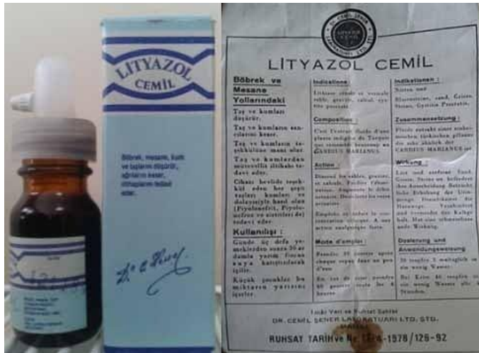
Lityazol Cemil'in şişe, kutu ve prospektüsü