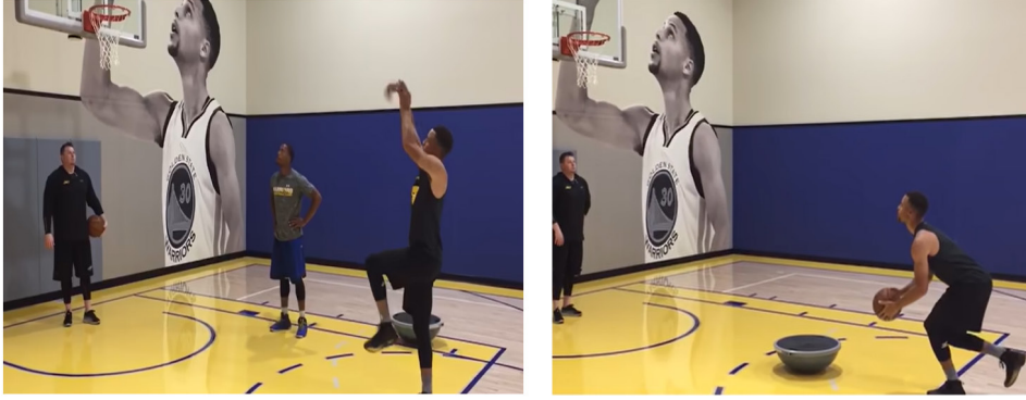
Şekil 21. https://bourgase.com/training/athletic-abilities/balance/