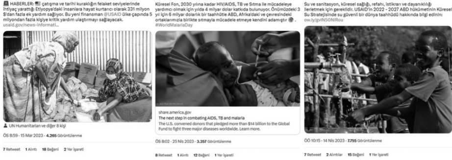
Şekil 3. Hastalık, Kıtık ve Kuraklığa Yönelik Paylaşımlar (USAID's Bureau for Humanitarian Assistance; Bureau of African Affairs; US Africa Media Hub, 2023)

Şekil 3'teki paylaşılan hedef kitle odaklı bölgesel veriler ışığında Malaria hastalığına yönelik aşı çalışmaları, kuraklık ile ilgili gıda yardımları ya da su stratejisine yönelik faaliyet içerikleri, verinin ne tür amaçlarda kullanıldığı ve kamu diplomasisi bağlamında yatırımlar yapıldığının göstergesidir.