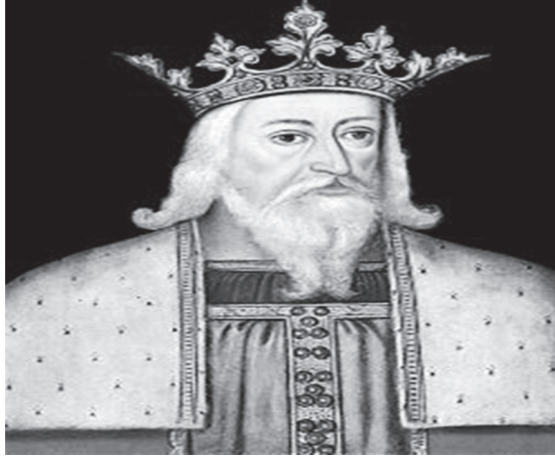
Şekil 3. King Edward.

yanlar Hokey Derneği, Erkekler ile aynı zamanda kuruldu: daha sonra 1895'te All England Kadınlar Hokey Derneği oldu. Bilinen ilk bayanlar hokey kulübü 1887'de kurulan Molesley'di ve ilk bayanlar uluslararası maçı 1896'da İrlanda ve İngiltere arasında Dublin'de oynandı (Reilly & Borrie, 1992).