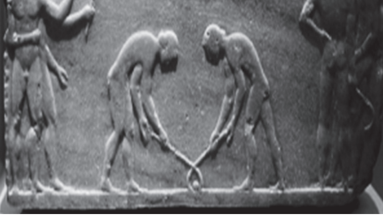
Şekil 1. MÖ 510 yılı mermer üzerine kabartma.