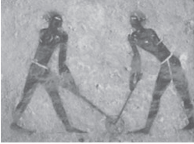
Şekil 2. Beni Hasan Gravür.

Kaynakça: (28.05.2022 https://hockeyhooked.com/history-of-field-hockey/ )