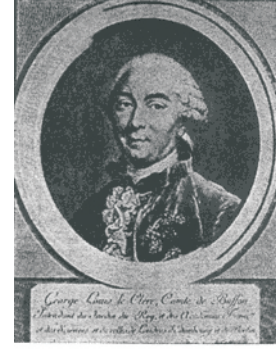
GEORGE LOUIS LE CLERC, Comte de Buffon Buffon (1707-1788)