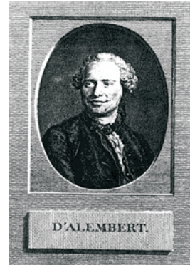
D'ALEMBERT D'Alembert (1717-1783)