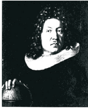
JACOP BERNOULLI 1697 Jacop Bernoulli (1654-1705)