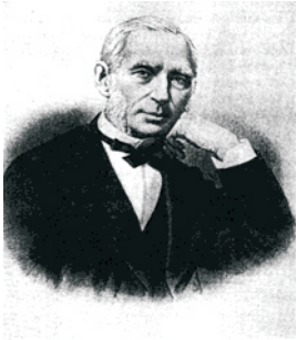
P. Chebyshev Chebyshev (1821-1894)