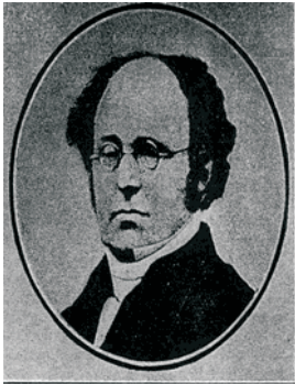
AUGUSTUS DE MORGAN De Morgan (1806-1871)