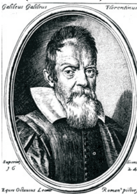
Galileus Galileus Florentinus Galileo (1564-1642)