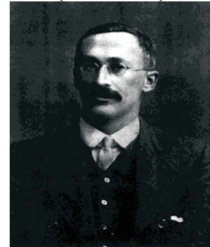
Student in 1908 Gosset (Student) (1876-1937)