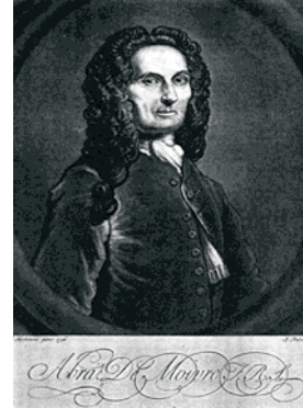
Abra. De Moivre De Moivre (1667-1754)