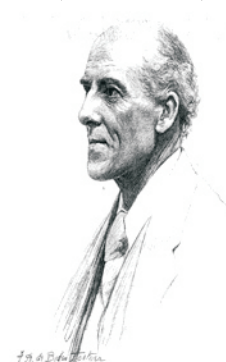
Karl Pearson (1857-1936)