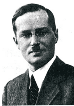
Jerzy Neyman (1894-1981)