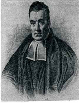
REV. T. BAYES Bayes (1702-1761)