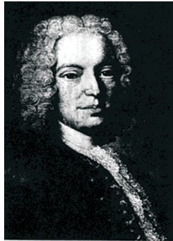
Daniel Bernoulli Daniel Bernoulli (1700-1782)