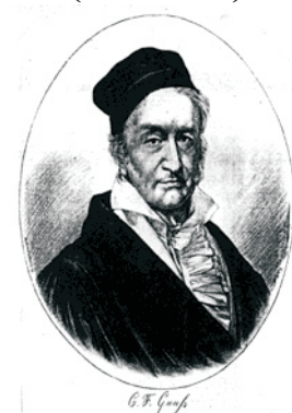
C. F. Gauss Gauss (1777-1855)