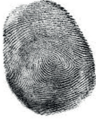
Şekil 1. Parmak izi

Teşkilatı ve Jandarma Teşkilatının yakın bir zamanda ortak veri tabanından yararlanmaya başlaması ile ülke çapında birçok faili meçhul olay aydınlatılmıştır.