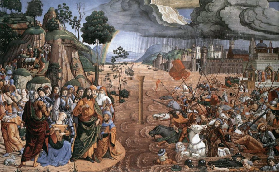
Resim 2. Cosimo Rosselli, Kızıldeniz'i Geçiş, 1481-1482, fresko, 350 x 572 cm, Cappella Sistina, Vatikan.