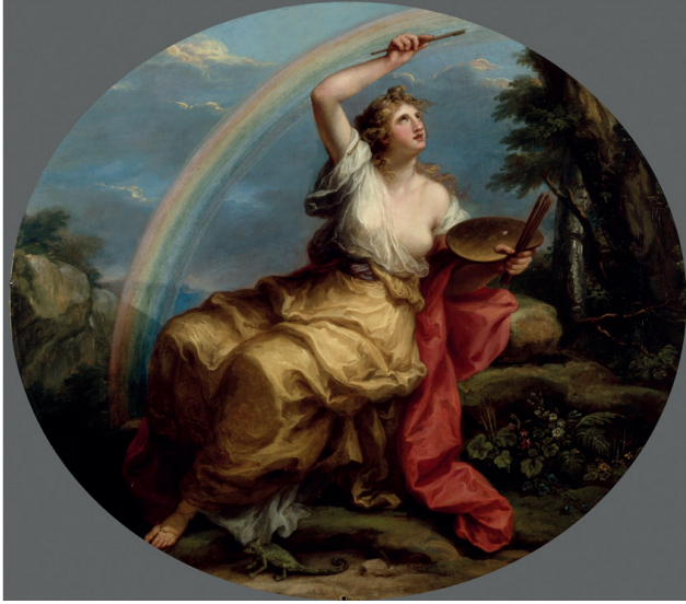
Resim 5. Angelica Kauffman, Renk, 1778, tuval üzerine yağlıboya, 126 x 148 cm, Royal Academy of Art, Londra.

Tasarım ve Renk adlı resimlerde, figürler fiziksel olarak yaratma eylemiyle meşgulken, Kompozisyon ve Buluş 'un figürleri yansıtma ile ilgilenmektedir. Buluş 'un kadın kahramanı ilham almak için gökyüzüne bakarken, Kompozisyon kafası ellerinin arasında derin düşüncelere dalmışken görülür. Tavanda sergilenildiğinde, resimler odanın her iki tarafında bir pratik ve bir teorik olmak üzere eşleştirilir. Kauffman, İtalyan Rönesansı'ndan ilham alan güçlü kadın bedenlerini değerlendirmişti. 18. yüzyıldaki sanatçılar ve sanat izleyicileri ikonografi okuma konusunda çok bilgili olurdu ve Kauffman'ın eserleri klasik ikonografik geleneklerden kaynaklanan birçok sembol içerir. Cesare Ripa'nın Iconologia'sı 2 gibi ikonografi sözlüklerinin etkileri seçilmektedir. Renk, bir elinde palet, diğerinde fırça tutan dalgalı saçlarıyla güzel bir kadın olarak tanımlanır. Bu tanımlama, Kauffman'ın tablosuna uyar, ancak Kauffmann, gökkuşağı ve bukalemunu, renk sembolleri olarak kullanırken ender görülen bir seçim yapmıştır. Çünkü onlar, geleneksel olarak, Havayı temsil ederler. Tasarım, elinde ayna ve pusula tutan genç bir adam olarak tanımlanır. Doğal bir manzarada içindeki sanatçı, boya fırçasıyla renk toplamak için üstündeki bir gökkuşağına ulaşır. Diğer elinde tek bir beyaz boya lekesi olan bir palet tutuyor. Ayaklarının ucundaki bukalemun, doğada bu-