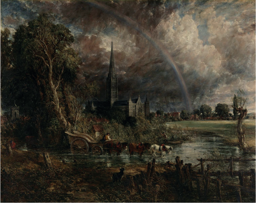
Resim 8. John Constable, Çayırdan Salisbury Katedrali'nin Görünümü, 1837, tuval üzerine yağlıboya, 180 x 218 cm, Tate Gallery, Londra.