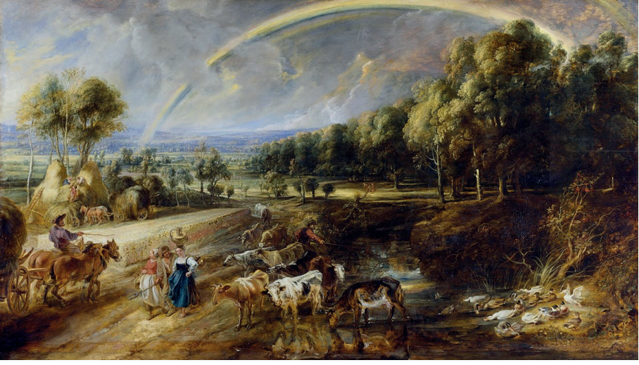
Resim 7. Peter Paul Rubens, Gökkuşağı Manzarası, c. 1636, meşe panel üzerine yağlıboya, 135.6 x 235 cm, The Wallace Collection, Londra.