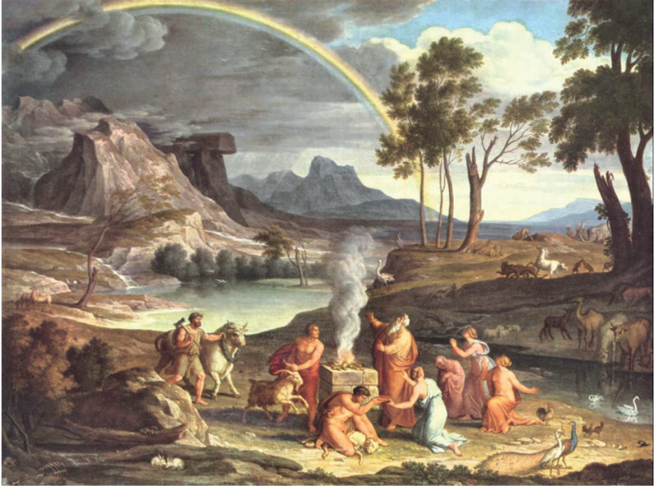
Resim 1. Joseph Anton Koch, Nuh'un Kurbanı ile Manzara, yakl. 1803, tuval üzerine yağlıboya, 86 x 116 cm, Stadelsches Museum, Frankfurt.

Eski Ahit'in Mısır'dan Çıkış kitabında, Musa Peygamber'in halkı için Kızıldeniz'i yardığı an aktarılmaktadır. Bu sahneyi canlandıran tüm eserlerde değilse bile, İtalyan Erken Rönesans sanatçısı Cosimo Rosselli'nin (1439-1507), Kızıldeniz'i Geçiş adlı freskinde (Resim 2), bu önemli olay bir gökkuşağı ile taçlandırılmıştır. Sistine Şapeli'nin duvarında yer alan Musa'nın yaşam döngüsünün bir parçasıdır. Tanrı'nın Mısır'a vebalar göndermesinden sonra, Firavun sonunda pes eder, İsrailoğullarına gitmeleri için izin verir, ancak daha sonra ordusuyla birlikte onların peşine düşer. Musa, İsrailoğullarının geçebilmesi için değneğıyle Kızıldeniz'in sularını yarar. Asayı ikinci kez kaldırdığında sular arkalarından kapanır ve başta Firavun olmak üzere peşlerine düşenler boğulur. Resmin sol tarafında yer alan sahilde, Musa elinde asası ile dikkat çekmektedir. Ön planda diz çökmüş kadın, Tanrı'ya müziğin tılsımıyla şükretmek için eline bir davul alan peygamber Miriam'dır ( www.wga.hu ). Kara gökyüzünün yavaşça aydınlandığı yerde, bir gökkuşağı belirmiştir. İlk kilise bu ikonografiyi bir vaftiz sembolü olarak yorumladı, çünkü kızıl denizin suyu, kutsallığın arındırıcı suyuyla ilişkilidir (De Capoa, 2003: 171).