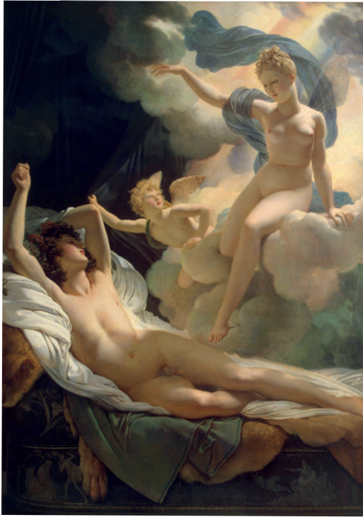
Resim 6. Pierre Narcisse Guerin, Morpheus ve Iris, 1811, tuval üzerine yağlıboya, 178 x 251 cm, Hermitage, St. Petersburg.

Yunan mitolojisinde gökkuşağını temsil eden İris, Pontos ve Gaiia'nın oğlu olan Thaumas ile Okeanos ve Tethys'in kızı olan Elektra'nın çocuklarından biridir. Gökkuşağı, denizden çıkarak, gökle yeryüzü arasındaki ilişkiyi kurduğu için, Olympos tanrıları İris'i de Hermes gibi ulak olarak, insanlara haber salmak için kullanırlar. Tanrı Zeus ve özellikle de Hera'nın hizmetindedir. "Ayağı tez" ve "yel gibi uçan" diye tanımlanan İris, Homeros destanlarında önemli bir rol oynar (Erhat, 162).