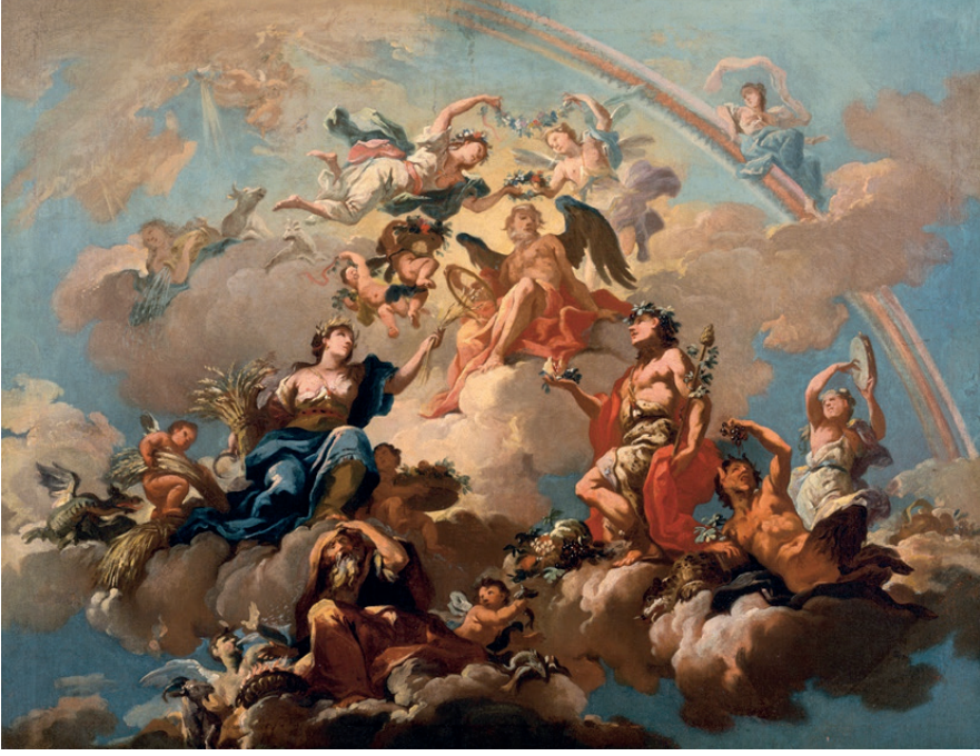
Resim 4. Bartholomäus Hohenberg , Dört Mevsim Kronos'a Saygı Gösterirken, c. 1737, tuval üzerine yağlıboya, 74.5 x 94.5 cm, Residenzgalerie, Salzburg.

Gökkuşağının güzelliğini gözler önüne seren başka bir alegorik resim de İs- viçreli Neoklasik sanatçı Angelica Kauffman'ın (1741-1807), 1778 tarihli Renk adlı (Resim 5) eseridir. 1768'de İngiltere'deki Kraliyet Akademisi'nin kurucu üyesi olan Kauffmann, kendini kanıtlamış bir tarih ressamıydı. 1780'lerde akademinin tavanına sanatın unsurları olarak bilinen dört resim yapmıştır. Her görüntü, sanatsal pratiğin temel bir ilkesini temsil eden alegorik bir figürü tasvir eder: icat, kompozisyon, tasarım ve renk. Sade bir ifadeyle Kauffmann, sanatı alegorik kadın figürleriyle somutlaştırarak temsil eder (McCormack, 2019: 8-9).