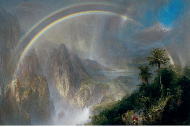
Resim 9. Frederic Edwin Church, Tropiklerde Yağmur Mevsimi, 1866, tuval üzerine yağlıboya, Fine Arts Museums of San Francisco, San Francisco.