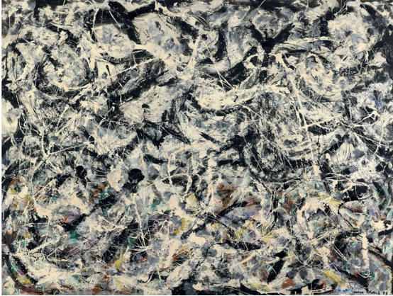
Resim 10. Jackson Pollock, Grileşmiş Gökkuşığı, 1953, keten üzerine yağlıboya, 182 x 244 cm, The Art Institute of Chicago, Chicago.

Amerikalı ressam Jackson Pollock (1912-1956), 1940'ların sonlarında, boyayı büyük ölçekli tuvallere damlatarak, dökerek ve sıçratarak devrimci bir Soyut Dışavurumculuk anlayışı geliştirmiştir. Pollock, sanatçının jestlerinin, malzemelerinin ve araçlarının ifade gücünü sorgulamış ve genellikle fırça yerine çubuklar, malalar ve palet bıçaklarıyla boya uygulamıştır. Ayrıca zemine yerleştirilmiş ya da duvara sabitlenmiş tuvaler üzerinde çalışarak şövale resmi kavramına meydan okumuştur. Görünür bir başlangıcı veya sonu olmayan kompozisyonları, tuvalin sınırlarının ötesine uzanır.