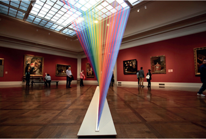
Resim 12. Gabriel Dawe, İnsan Yapımı Gökkuşağı , 2017, Toledo Museum of Art, Texas.

lendirilen ve Meksika'da büyüyen bir erkek çocuk için yasak sayılan bu alanlar, sanatçının yaratım dünyasının baş elemanları olmuştur. Bu nedenle, eserleri, kültürüne çok yerleşmiş olan erkeklik ve maçoluk kavramlarını da alt üst etmektedir. Sanatçı, iplikle büyük ölçekli enstalasyonlar yaratarak, sosyal yapıları sorgulayan ortamlar üretmeye ve bunların evrim teorisi ve doğanın kendi kendini organize eden gücüyle olan ilişkilerini değerlendirmeye çalışır (www.conduitgallery.com). 2017 yılında, Toledo Müzesi'nin büyük galerisi için özel olarak tasarladığı İnsan Yapımı Gökkuşağı adlı eseri (Resim 12), Plexus serisinin 35 numaralı parçasıdır. Sanatçının başka ortamlar ve sergiler için de ürettiği gökkuşağı enstalasyonları, kırılan ışık demetleri gibi görünen ve binlerce çok renkli iplikten oluşan çalışmalardır.