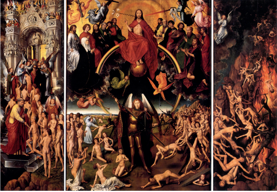
Resim 3. Hans Memling, Son Yargılama, 1467-71, ahşap üzerine yağlıboya, 161 x 221 cm (orta), 72,5 x 223, 5 cm (kanatlar), Muzeum Narodowe, Gdansk