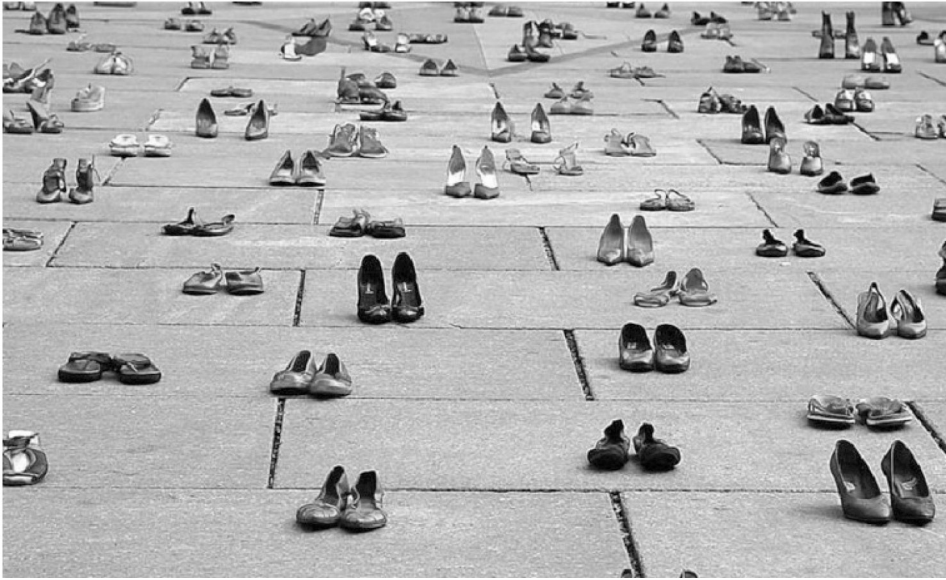
Resim 5. Veri Bülteni, 16 Ağustos 2020, by VOYD.

Toplamda kasım ayında 25 kadın cinayeti işlenmiş ve 21 şüpheli kadın ölümü yer almaktadır. Bir sonraki resimde ise kadın ölümleri kırmızı ayakkabıların yer aldığı bir resim ile farkındalık yaratılmak istenmiştir.