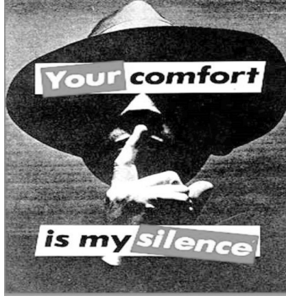
Resim 1. Barbara Kruger, 1981.

Resim 1 Barbara Kruger tarafından yapılmış ve feminist sanat olarak kabul edilmektedir. Yukarıdaki imgede de görüldüğü üzere şapka giymiş olan görsel adam figürü kelimeler ile birleşince “Your” ve “Silence” kelimeleri erkek egemen toplumunun kendi huzuru ve konforu için kadını susturmasını sembolize etmektedir. Çalışmadaki belirgin olmayan yüz ise toplumdaki kadını susturmayı ve de kontrol etmeyi isteyen erkek egemen toplumu temsil etmektedir. Bir başka açıdan bakıldığında zaman ise belirsiz olan imge erkeği değil de belki kadını simgelemektedir. Çünkü kadın kendi huzuru ve de erkeğin huzuru için susmakta ve ondan yapılmasını istediklerini sorgulamadan yapmaktadır.