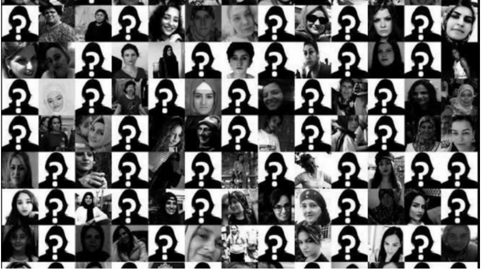
Resim 4. T24: Bağımsız İnternet Gazetesi

Bağımsız İnternet Gazetesi “65 günde 67 kadın öldürüldü!” başlığı ile internet gazete sitesinin paylaşmış olduğu fotoğraf siyah beyaz renklere oluşmakla birlikte ölen kadınların resimleri ve de kadın silüeti üzerine ? (soru işareti) kullanılarak oluşturulmuştur. Verilmek istenilen mesaj ise resimde yer alan kişilerin ortak noktasının kadın olması. Yaşın, eğitim seviyelerinin beden farklarının olmadığını vurgulayan resim soru işareti ile gösterdiği yerlerde ölen kadınların cinsiyetleri isimlerinin değil de kadın olmalarının önemini belirtmiştir. Buna ek olarak soru işareti ile belirtilen bölümlerde yer alan kadınların kayıp olduğu veya kim olduğu vurgusu da yapılmak istenmiştir. Aşağıdaki tabloda da görüleceği üzere “16 kadının hangi bahaneyle” öldüğünün bilinmediğini belirtmiştir.