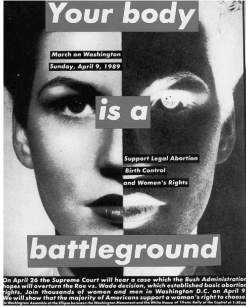
Resim 2. Barbara Kruger, 1989.

mavi olarak kabul edilmiştir. (Deniz Özer, 2012, s. 296). Ayrıca kırmızı tehlike ve yasakları da sembolize etmektedir. (Özer, 2012, 272) Kruger' in eserinde ise kırmızı vücudu, tehlike ve yasakları bir araya getirmek için kullanılmıştır. Çünkü "You" yani kadın erkek, güç, kapitalizm, toplumsal kalıp yargılar ve söylemler bir başka deęiş ile siyah beyaz olan kültürel ideolojiler toplumları ve kişileri beden ve akları sessizliğe ("silence") zorluyor.