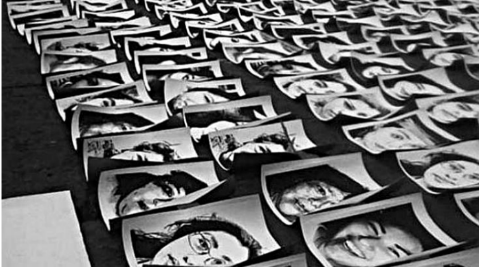
Resim 6. Özgür İstanbul, 12.06.2019.