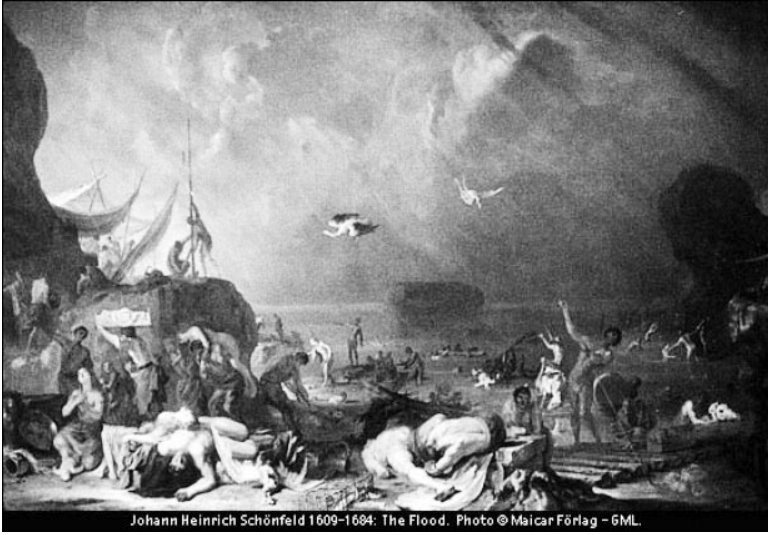
Görsel 5. Tufan olayını gösteren temsili resim. (Resim: Johann Heinrich Schönfeld tarafından 1636 yılında yapılmıştır). 7

Mitolojide, insanın tanrılar tarafından kitlesel bir şekilde cezalandırılmasına dair anlatılar önemli bir yere sahiptir. Farklı biçimlerde (kuraklık, kıtlık, vb.) görülen kitlesel cezaların en tipik olanı tufan yani sel felaketidir. Bu anlatılar Mısır ve Mezopotamya mitolojisinde önemli bir yere sahiptir. Tufan mitoslarında tanrının insanlığı cezalandırmasının bir sonucu olarak evrenin ve insanlığın yok oluşu anlatılmaktadır (Cotterell&Storm, 1999: 6).