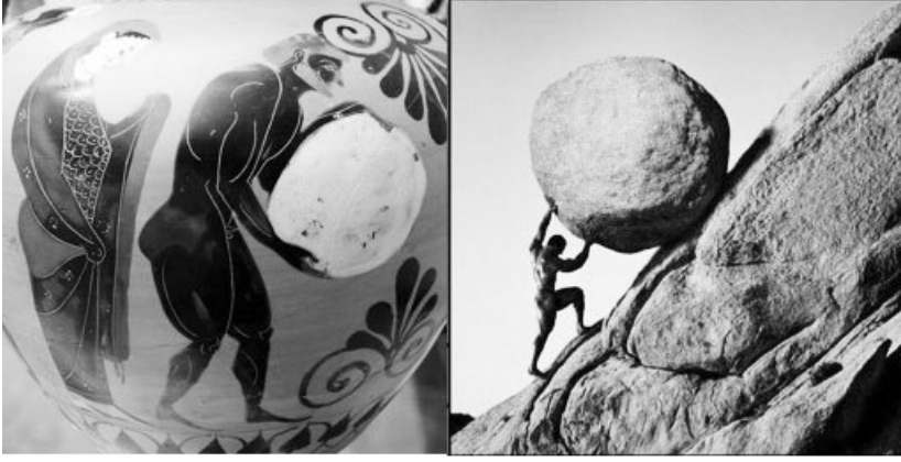
Görsel 2. Tanrılara karşı gelen Sisiphos'un cezasını gösteren resim. 4

Homeros'un Odyseia 'sında Odysseus tarafından anlatılan ceza şöyledir: “ Sisiphos'u, gördüm korkunç işkenceler çekerken: Yakalamış iki avucuyla kocaman bir kayayı ve de kollarıyla bacaklarıyla dayanmıştı kayaya, habire itiyordu onu bir tepeye doğru, işte kaya tepeye vardı varacak, işte tamam, ama tepeye varmasına tam bir parmak kala, bir güç itiyordu onu tepeden gerisin geri, aşağıya kadar yuvarlanıyordu yeniden baş belası kaya, o da yeniden itiyordu kayayı teknil kaslarını gere gere, kopan toz toprak habire aşarken başının üstünden, o da habire itiyordu kayayı, kan ter içinde ”(Homeros, Odyseia , XI: 595-600). Sisiphos söylenin de açıkça görüldüğü üzere, insan ne kadar akıllı olursa olsun tanrıları aldatmamalı ve onların öfkesine neden olacak en ufak bir olayın içinde yer almamalıdır. Aksi takdirde hem bu dünyada hem de öldükten sonra hiç bitmeyecek acılara katlanmayı göze almalıdır.