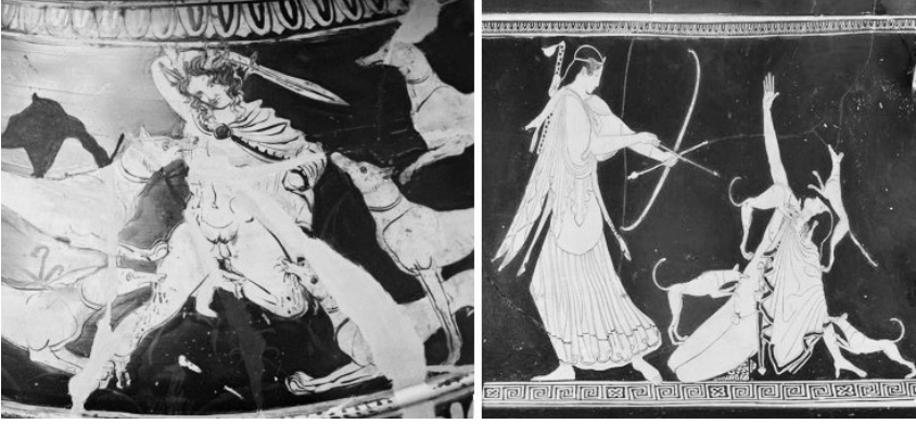
Görsel 3. Aktaion'un kendi köpekleri tarafından parçalandığını gösteren krater. 5

Tanrıça Artemis, kendisini çıplak gören Aktaion'un bu küstahlığını asla unutmamış. Üstelik gurura kapılarak kendisini bir tanrıçadan üstün gördüğü hatasının cezasını ödemişken yeniden bir saygısızlık yapması kabul edilir şey değilmiş. Aktaion'un bu küstahlığına içerleyen tanrıça onu bir geyiğe çevirmiş ve elli köpeğini de üstüne salmıştır (Erhat, 2007: 28). Bir geyiğe saldırdıklarını düşünen köpekler kendi efendilerini tanıyamadıklarından onu paramparça etmişlerdir. Ardından efendilerini aramaya başlayan köpekler acı bir şekilde uluyarak günlerce aç susuz dolaşmışlar ve Kheiron'un mağarasına kadar ulaşmışlardır. Köpeklerin bu haline acıyan Kheiron, Aktaion'un bir heykelini yapmış ve onları bu şekilde avutmaya çalışmıştır (Cömert: 2010: 47). Aktaion'un bu cezasının Semele'ye âşık olduğu için Zeus tarafından verildiğini anlatan mitler de vardır. Fakat çoğunlukla tanrıça Artemis'in gazabına uğradığı kabul edilmektedir (Grimal, 1990: 12). Nihayetinde Aktaion bir kutsal yani tanrıça tarafından cezalandırılarak hazin bir şekilde can vermiştir.