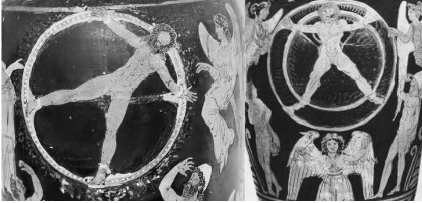
Görsel 1. Sonsuza dek yanmaya mahkûm edilerek cezalandırılan İksion'un betimlendiği amphora. 3

İksion, Teselya'da Lapithlerin 2 kralıdır. Krallığı esnasında Deioneus'un kızı Dia'ya talip olmuş, kızı almak için babasına armağanlar göndermeye yemin etmiştir. Ama İksion evlendikten sonra sözünü tutmamış ve hediyeleri istemek için gelen karısının babasını kor haline gelmiş kömürlerle dolu bir kuyuya atarak öldürmüştür. Hem yeminini bozan hem de ailesinden birini öldüren İksion'un günahı o kadar büyüktür ki kimse onu bu günahlardan arındıramamıştır (Grimal, 1990: 228). Öyle ki günahlarından arınmak için gereken töreleri yapmaya kimse korkudan yanaşamamıştır (Erhat, 2007: 153). İksion'un bu haline acıyan ulu tanrı Zeus ona merhamet göstermiş ve onu işlediği günahlardan kurtarmıştır. Fakat günahkâr İksion, Zeus'un bu iyi niyetine karşı nankörlük etmiş ve onun karısı olan Hera'ya âşık olma cüretini göstermiştir (Grimal, 1990: 228).