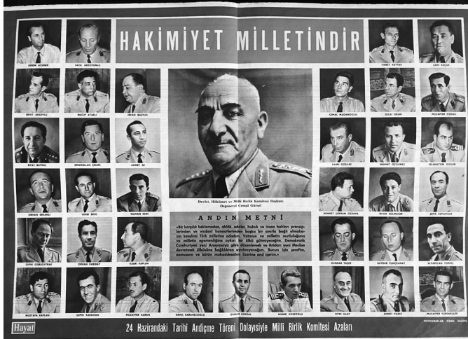
Resim 4. Hayat Haftalık Mecmua, Sayı: 27, 1 Temmuz 1960, ss. 16-17.

Türk Silahlı Kuvvetleri'nin bildirisinde 27 Mayıs'ın gerekçesi şöyle açıklanmıştır (Turan, 1999: 280):