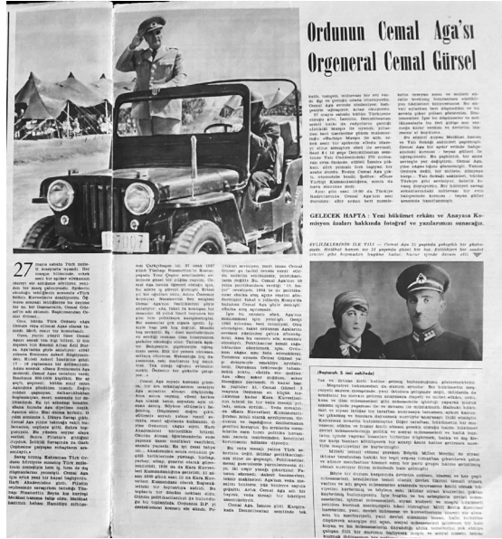
Resim 1. Hayat Haftalık Mecmua, Sayı: 23, 3 Haziran 1960, ss. 27-28.