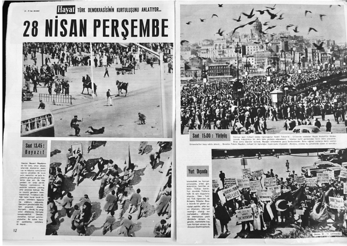
Resim 3. Hayat Haftalık Mecmua, Sayı: 23, 3 Haziran 1960, ss. 12-13.

Dünya'nın çeřitli ülkelerinde askerin ya da daha güçlü bir ifadeyle ordunun siyasal otoriteye müdahale ettiği bir gerçektir. Bu müdahaleler ülkelerin gelişmişlik düzeylerine ve demokrasi yapılarına göre farklılıklar göstermektedir. Eric Nordlinger, askerlerin siyasal rejimin işleyişine müdahalesini siyasal rejimin niteliğine göre; “hakemlik”, “bekçilik” ve “yöneticilik” olmak üzere üç farklı işlevle açıklamaktadır (Karatepe, 1999: 26). 27 Mayıs'ta gerçekleşen müdahalenin bu üç işlevi de yerine getirmeye çalıştığı anlaşılmaktadır. Nitekim aşağıda değinileceği gibi Gürsel'in hitabesinde “partiler üstü tarafsız bir idarenin nezaret ve hakemliği” müdahalenin işlevlerini Nordlinger'in kategorisinde yer aldığı haliyle bizzat açıklamaktadır.