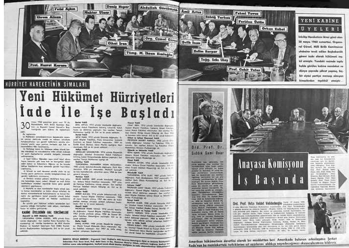
Resim 5. Hayat Haftalık Mecmuası, Sayı: 24, 10 Haziran 1960, ss. 4-5.

çevrelerden” oluşmaktadır. Hayat Mecmuası’nın haberlerinden; bu gruplar içinde öne çıkanın üniversiteler olduğu anlaşılmaktadır. Mills’e (1974: 28) göre toplumsal yapıda seçkinlerin dolaşımı beraberinde bir takım işbirliği ve işbölümünün gerçekleşmesini de getirir.