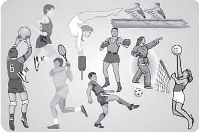
Şekil 2. Modern Spor Branşları (DPTb, 2021)